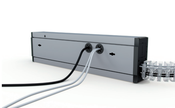
Duplo kit alimentación trasera y fijación. Duplo back feeding and fixing kit.