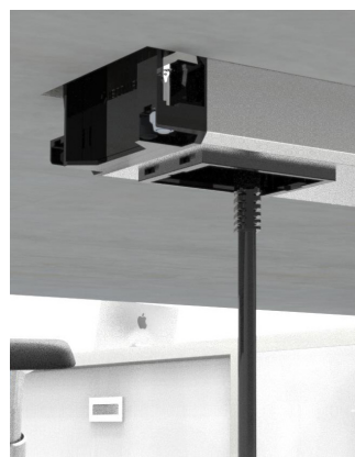
Detalle fijación y entrada de datos. Detail of fixing and data input.