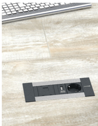
Intro empotrado en mesa. Intro built-in to table.

Fabricación a medida. Custom manufacturing.